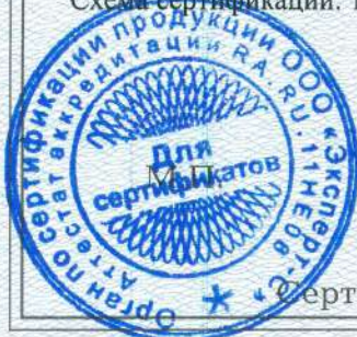
Схема сертификации: Ic